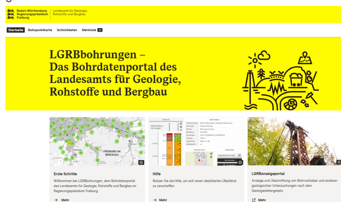
Abb.2: Startseite LGRBbohrungen